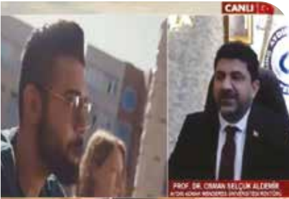
Rektörümüz Gün Başlıyor Programına katıldı