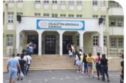
Yabancı uyruklu öğrenci sınavını yurt içi ve yurt dışı 5 merkezde başarıyla tamamladık