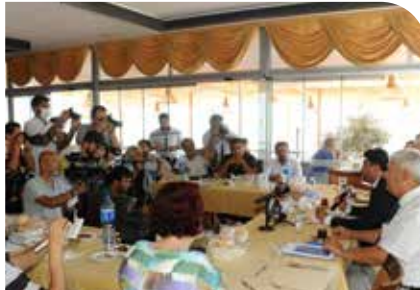
Aydın'da görev yapan basın mensuplarını Üniversitemizde ağırladık