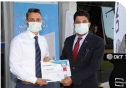
Mühendis Formasyon Eğitimi, Sertifika Töreni ile sona erdi