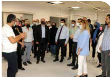
AK Parti Aydın İl Yönetimi Hastanemizi ziyaret etti