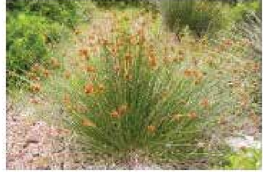
Üzerinde yaşadığı bitki Hasır sivriotu ( Juncus acutus )